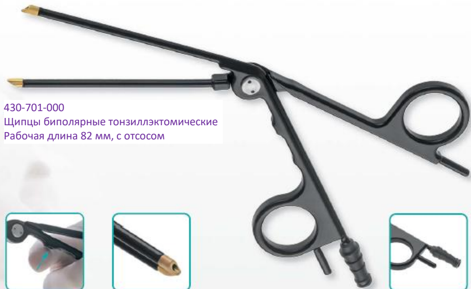
430-701-000 Щипцы биполярные тонзиллэктомические Рабочая длина 82 мм, с отсосом