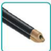
Отсос на самом кончике