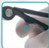
Отсос управляется пальцем