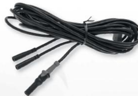
Кабели биполярные, длина 4,5 м

Bipolar Cables for RZ Tonsillar Forceps 4.5m cable length