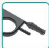
Соединение отсасывающего канала